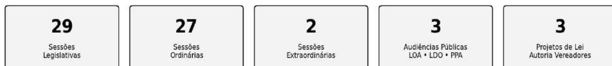
Principais Temas Debatidos nas Sessões Legislativas